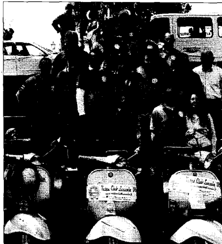
Il Vespa Club Lucania

NEMOLI - Il Vespa Club Lucania ha partecipato a Scalea, nel cosentino, al secondo raduno interregionale Vespa "Riviera dei Cedri". Si è tenuto ieri a Scalea il "Riviera dei Cedri" secondo raduno interregionale di Vespa. La giornata è proseguita con la mostra dei modelli "Vespa" dei partecipanti in Piazza Saverio Ordine mentre alle ore 11 si è andati alla volta di Santa Domenica Talao, dove i partecipanti hanno potuto visitare l'antico borgo dell'alto Tirreno cosentino. Il ritorno a Scalea è stato presso il ristorante "Il Metastasio" dove è stato consumato il pranzo e sono state effettuate le premiazioni che hanno visto protagonisti i Vespa Club lucani, quelli pugliesi, campani e calabresi. All'evento calabrese era presente