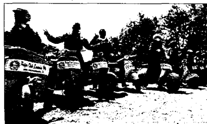
Un momento di un raduno del Vespa Club

NEMOLI. Dopo il successo di "Basilicata coast to coast" continua la produzione cinematografica sul nostro territorio. Nei giorni scorsi infatti, sono cominciate le riprese del Vespa Club Lucania, primo club vespa in Basilicata, per il documentario che vedrà coinvolti i sei paesi della Valle del Noce (Nemoli, Rivello, Trechina, Lagonegro, Maratea, Lauria).